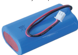
Battery cell pack

If that does not work, there is a defect - in this case the battery should no longer be used. Tricks from the Internet should never be used - there is a risk of fire and explosion, even after weeks of seemingly normal use.